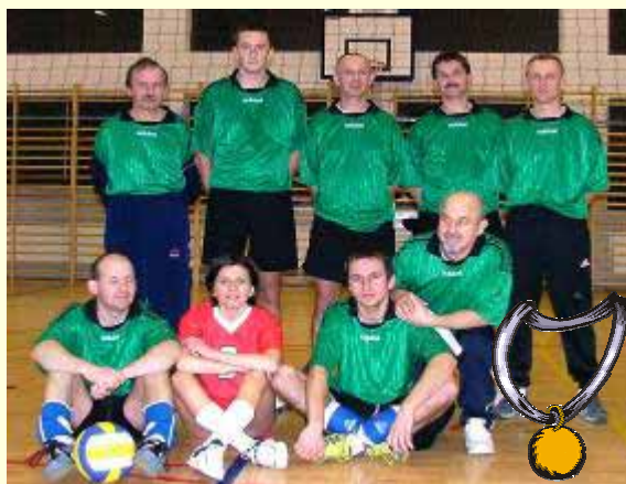
Zwycięska drużyna: ZSZ Grybów