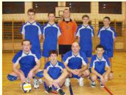
Gimnazjum Biała Niżna