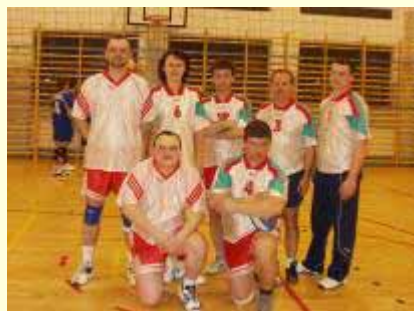
Urząd Miejski w Grybowie