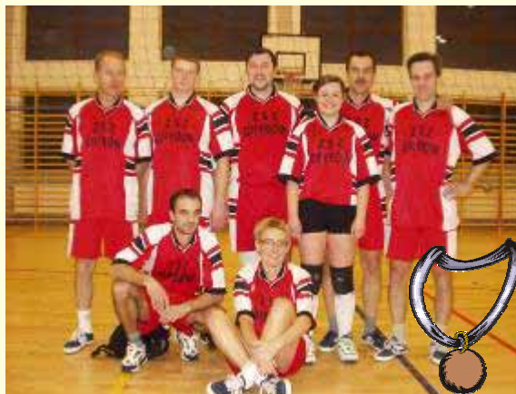
III – miejsce: STOLBUD Grybów