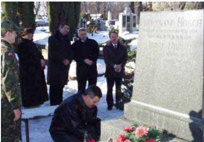
▲ Chwila zadumy przy rodzinnym grobowcu Hosców...