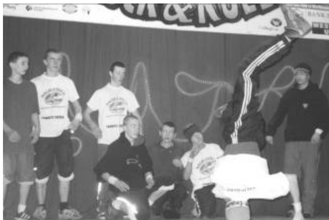
▲ Pokaz break dance (artyści z Berestu, Muszyny i Krynicy)

W akcji uczestniczyły niżej wymienione przedszkola i szkoły: SP w Stróżach, SP we Florynce, SP w Polnej, SP nr 1 w Grybowie, SP w Kąclowej wraz z PCK „Wiewiórka”, Gimnazjum w Krużlowej, w Grybowie oraz w Białej Niżnej, Przedszkole w Grybowie oraz im. Fundacji Polsat w Stróżach, Samorząd Szkolny Zespołu Szkół Zawodowych w Grybowie.