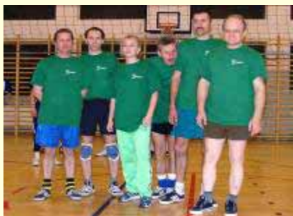
Spółdzielnia Inwalidów „Karpaty”