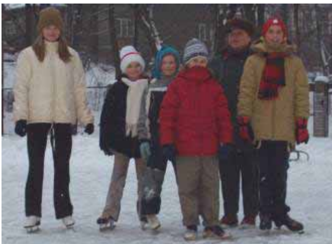
▲ Sport to zdrowie... na lodowisku w Grybowie.