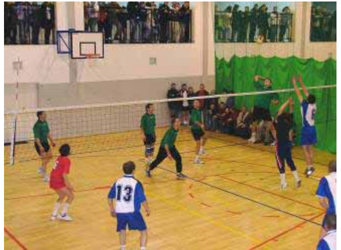
▲ Turniej Piłki Siatkowej. Owacja na stojąco po każdym zagranium...