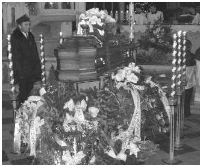
Warta honorowa przy trumnie...

Od 25 listopada 2002 roku stan zdrowia Księdza Kaźmierczyka uległ pogorszeniu. Pomimo tego nadal wykonywał swoje obowiązki duszpasterskie a ostatnią Mszę św. odprawił w dniu 25 grudnia 2003 roku. Zmarł w dniu 14 stycznia 2004 roku w 58 roku swojej posługi kapłańskiej.