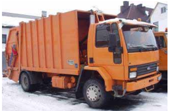
▲ Nowy rycerz w walce ze śmieciami.