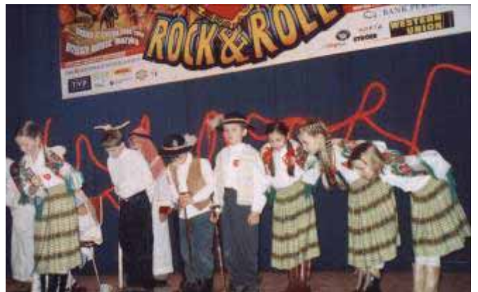
▲ WOSP: Jasełka w wykonaniu uczniów kl. III, SP Nr 1 w Grybowie.