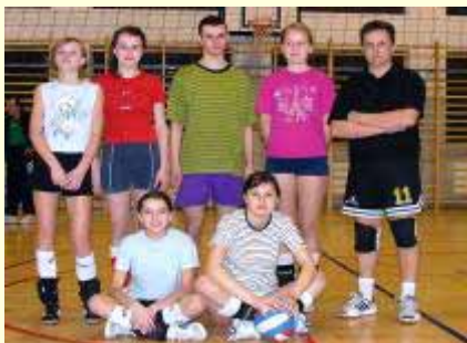
Gimnazjum w Grybowie