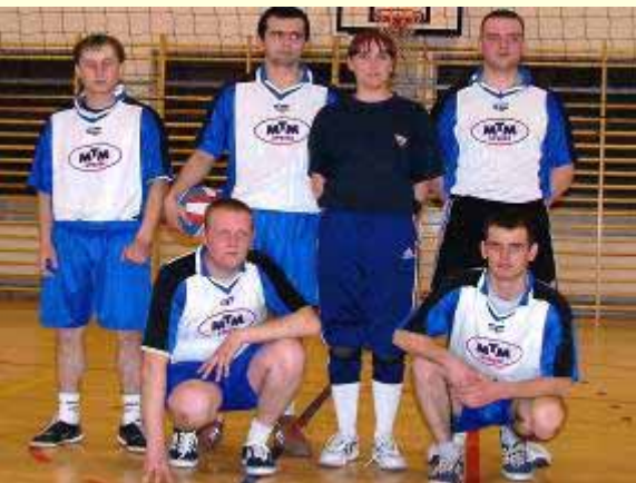
IV miejsce – MTM Stróże