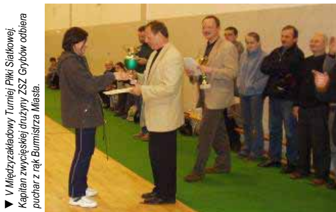
▼ V Międzyczekładowy Turniej Piłki Siatkowej. Kapitan zwyciężskiej drużyny ZSZ Grybów odbiera puchar z rąk Burmistrza Miasta.