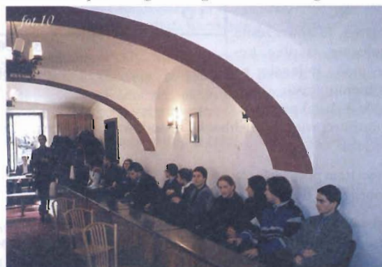
Młodzież w sali posiedzeń Rady Miejskiej w Grybowie