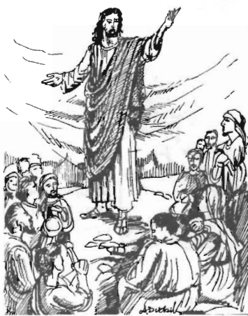
KAZANIE NA GÓRZE - Pan Jezus ogłasza OSIEM BŁOGOSŁAWIENIŃSTW Rys. Anna Dudzik

W następnym numerze KG dalsza część rozważań na temat: "Osiem Błogosławieństw"