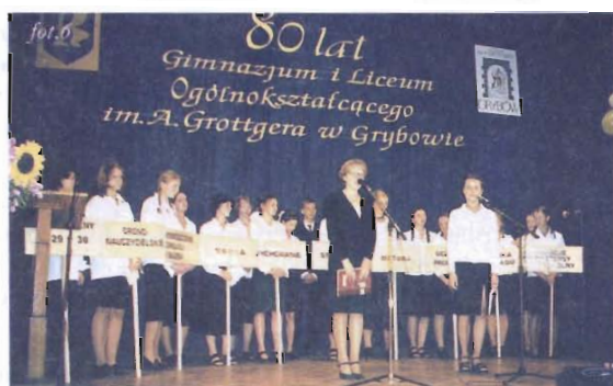
Młodzież szkolna w programie artystycznym prezentuje fragment historii szkoły

Absolwenci dopisali tak licznie (mamy dane o ok. 500 osobach uczestniczących w Zjeździe), że nie wszystkich kinowa sala pomieściła. Wykorzystując piękną pogodę - absolwenci rozeszli się po parku, grybowskich zaułkach i okolicznych kafejkach, by tam cieszyć się spotkaniem po latach.