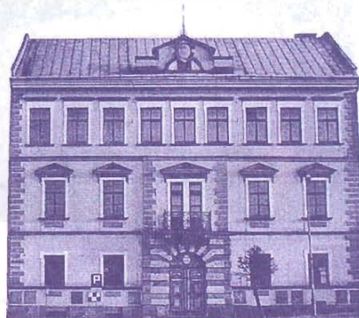
Fronton LO w Grybowie