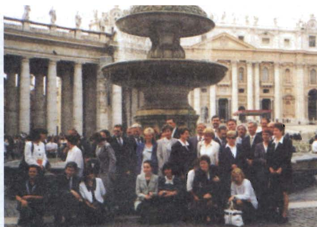
Grupa pielgrzymów z gminy i miasta Grybowa

... Dziękuję Wam za to, że nie zapomniacie o papieżu. Dziękuję dzisiaj w szczególności sposób za ten piękny śpiew, który przypomina mi czerwcowe odwiedziny Polski. Ze wzruszeniem wysłuchałem życzeń jakie skierowaliście do mnie, a także tych, które zostały wyśpiewane. Jest to również zasługą obecnych tu chórów i orkiestr, które też z całego serca witam... Niech Bóg błogosławi Was, wasze rodziny i tych, którzy nie mogli być tutaj obecni, a bardzo tego chcieli. Niech Bóg błogosławi całą naszą Ojczyznę.”